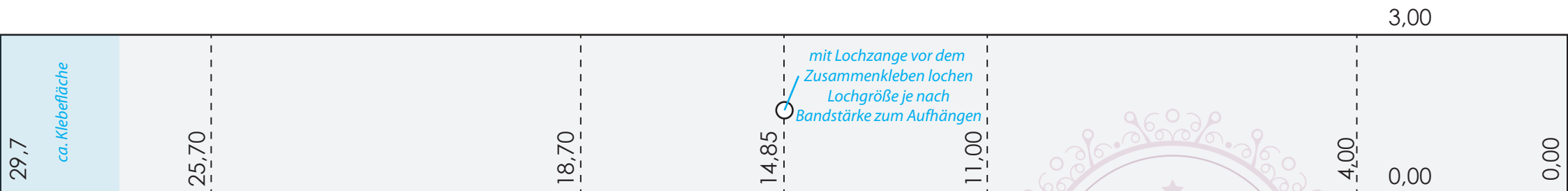
Haus 1 - schmal - Streifengröße = 3,0 / 29,7cm